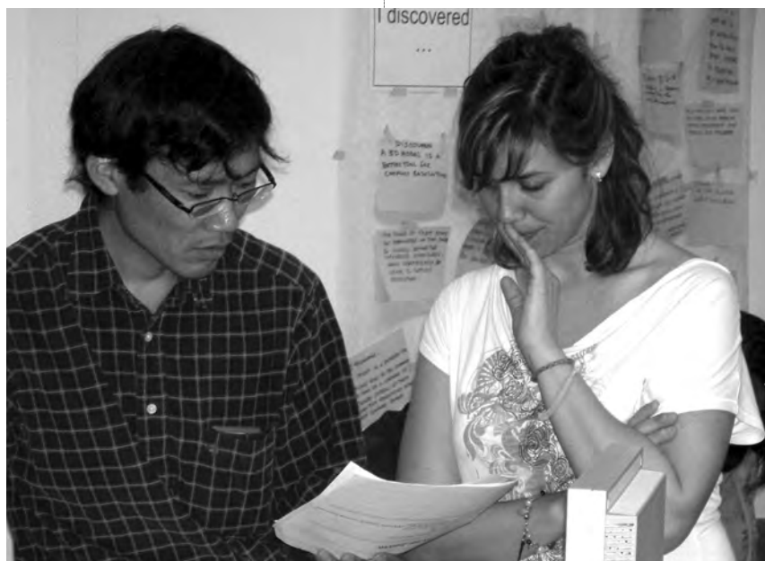
Figura 1: Muro de la democracia en una actividad de capacitación en ITC, Enschede, Países Bajos.